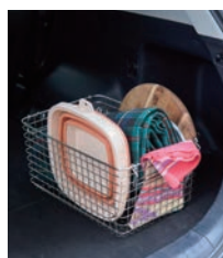
折りたたみ式でコンパクトに収納