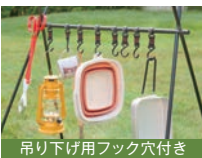
吊り下げ用フック穴付き