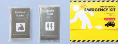
①アルミブランケット ②携帯トイレ

パッケージには緊急時に役立つ「災害時 燃料供給住民拠点サービスステーション」のQR付き