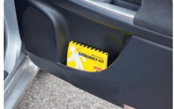
常備しやすい、車のサイドポケットに収納できるコンパクトサイズ

(本体サイズ) ①アルミブランケット/約140×210cm ②携帯トイレ/約13.3×34cm (材質) ①アルミブランケット/アルミ蒸着PETフィルム ②携帯トイレ/ポリエチレン・XPEフォーム・高吸水性ポリマー (セット内容) アルミブランケット×1・携帯トイレ×1