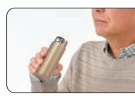
シニアの方も飲みさされる軽量&コンパクトサイズ