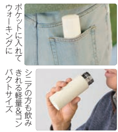
ポケットに入れて ウォーキングに さらされる軽量&コン パクトサイズ シニアの方も飲み さされる