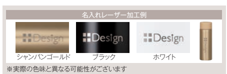
※実際の色味と異なる場合がございます