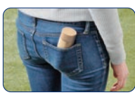
ウォーキングや散歩に