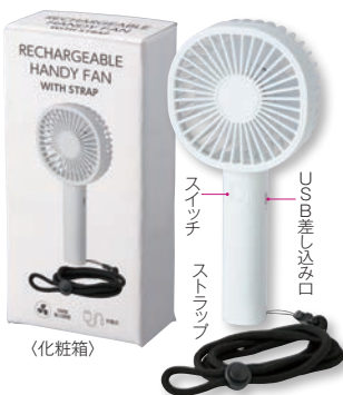
〈化粧箱〉 USBケーブル付き ストラップは着脱可能 底面に滑り止め付き

〈本体サイズ〉本体/約9×4.8×19cm USBケーブル/全長約90cm ストラップ/全長約60cm 〈材質〉本体/ABS樹脂・ポリプロピレン・シリコンゴム USBケーブル/PVC ストラップ/ポリエ ステル・PBS-POM (セット内容)・USBケーブル×1・ストラップ×1 (その他)電源容量/1200 mAh 連続使用時間 弱風:5時間 中風:2時間 強風:1時間 充電時間:約3時間