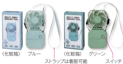
〈化粧箱〉 ブルー 〈化粧箱〉 グリーン ストラップは着脱可能 スイッチ