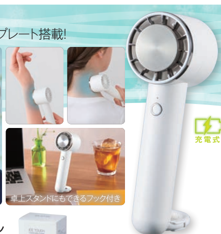
〈化粧箱〉 USBケーブル付き USBケーブルで充電します カラビナ付き

〈本体サイズ〉本体/5×6×16cm USBケーブル/全長約90cm USBケーブル/PVC (セット内容) USBケーブル(約90cm)×1 連続使用時間 弱風:約5時間、強風:約2.5時間、 冷却約10分、約1.5時間 充電時間:約2時間