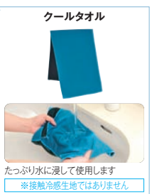
クールタオル たつぷり水に浸して使えます ※接触冷感生地ではありません