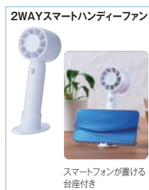
2WAYスマートハンディーファン スマートフォンが置ける台座付き

〈本体サイズ〉2WAYスマートハンディーファン/約5×4.8×15.3cm(手持ち使用時) 約5×7.5×16.2cm(卓上使用时) クールタオル/約90×30cm クールタオル/ポリエステル (その他)スマートファン/単4形乾電池2本使用(別売) 連続使用時間 約5.5-6.5時間