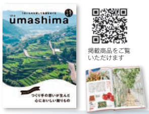
④ 約165品 (2品選べる品含む) 160P