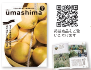
② 約114品 144P