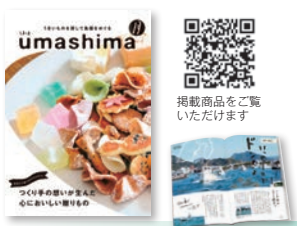
① 約100品 144P