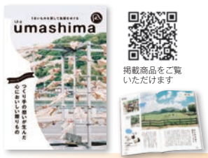
③ 約113品 144P