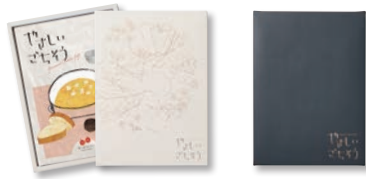
①②③④⑤のケースデザイン) (⑥・⑦のケースデザイン)