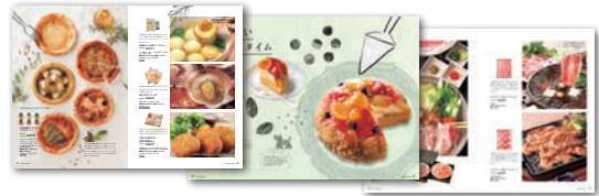
▲④緑のえだまめ カatalog誌面イメージ