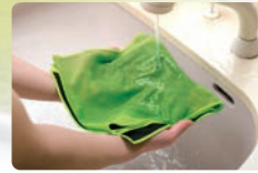
たっぷり水に浸して使います