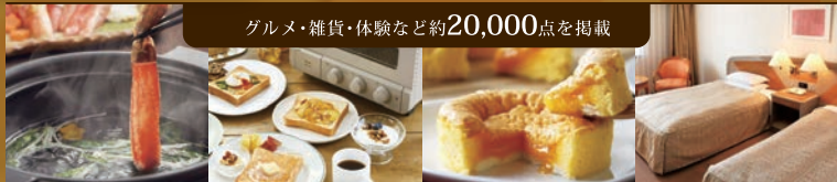
グルメ・雑貨・体験など約20,000点を掲載